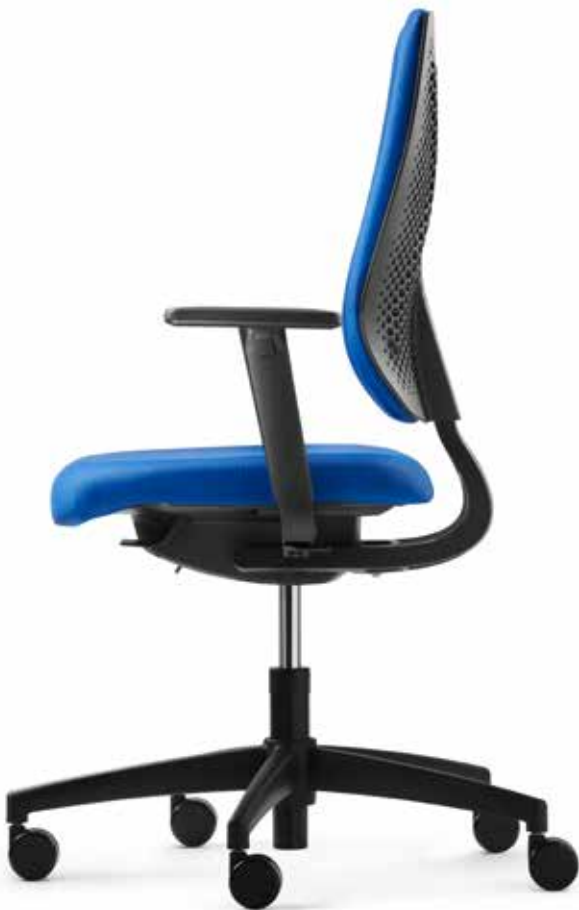
AU SP 7639 comfort + Accoudoirs | Armleuningen A408KGS

speed-o staat voor ongecompliceerde individualiteit. De gepereerde, luchtdoorlatende rugleuningschaal geeft de stoel een tijdloos, fris uiterlijk, dat dankzij de kleurige stoffering met textiel of netstof een individuele touch krijgt. De rondom gestoffeerde versie van de speed-o comfort plus zorgt bovendien voor een gezellige sfeer op de werkplek. De in hoogte verstelbare rugleuningen zijn dankzij het Easy-Touch-systeem eenvoudig en probleemloos al zittend verstelbaar.