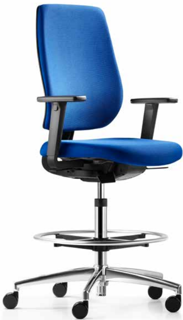
AU SP 7639_CFR comfort + Aaccoudoirs | Armeleuningen A208KGS

speed-o als countermodel is een ideale oplossing voor staverkplekken en plekken waar gebruikers slechts even zitten. De lastafhankelijk blokkerende wielen voorkomen dat de stoel per ongeluk wegrolt als deze wordt belast. Als alternatief staan glijders garant voor stabiliteit. De stroeve, verchroomde voet-enring kan eenvoudig in hoogte worden veresteld. De Syncro-Relax-Automatic®-techniek stelt zich bovendien automatisch in op het lichaamsgewicht.