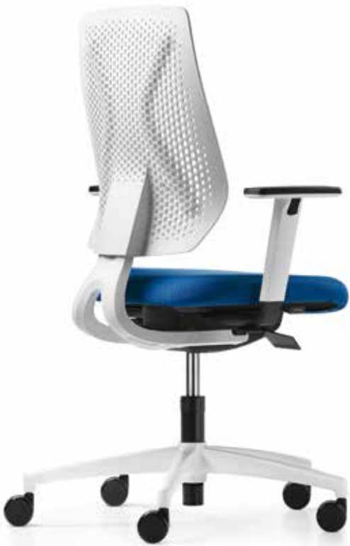
AU SP 7619 membrane + Accoudoirs | Armleunigen A208KGS