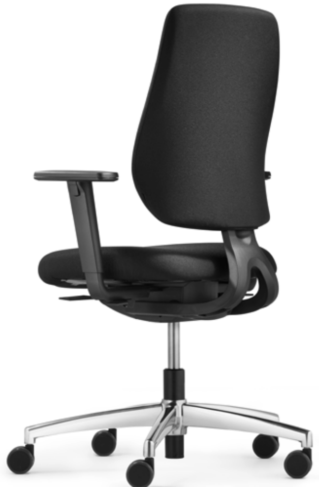
AU SP 7649 comfort plus + Accoudoirs | Armleuningen A408KGS