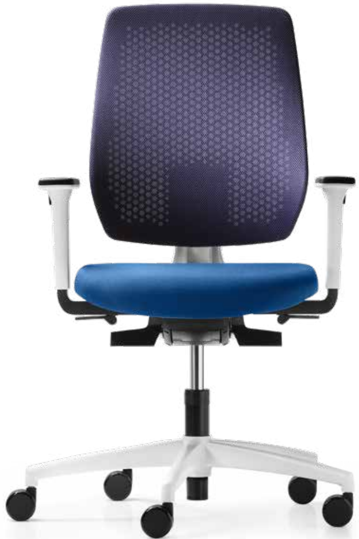
AU SP 7629 style + Accoudoirs | Armleunigen A408KGS