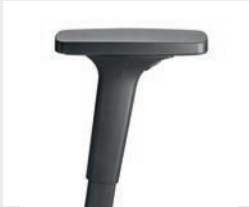
A240KGS (2F) Manchettes en PU Armsteunen PU