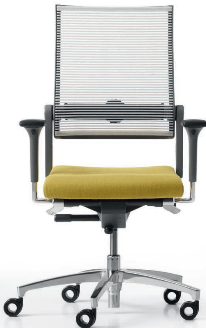
SD LO 3010 + Accoudoirs | Armleunigen A441APO