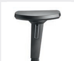
A618KGS (6F; NPR) Manchettes en PU souple Armsteunen PU soft

Coloris du fourreau d'accoudoir = Coloris du modèle Kleur van de armleuninghuls = modelkleur