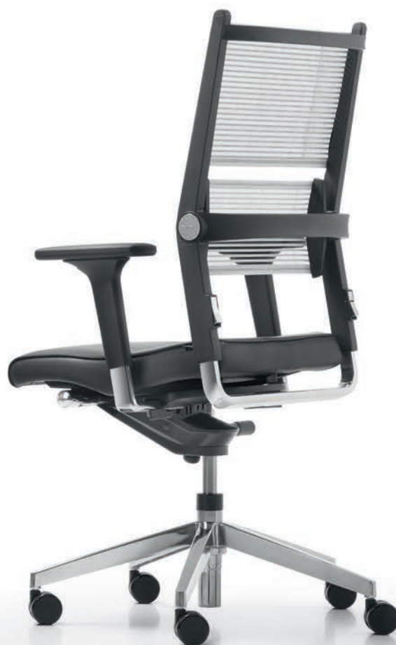
SD LO 3380 + Accoudoirs | Armleunigen A441APO