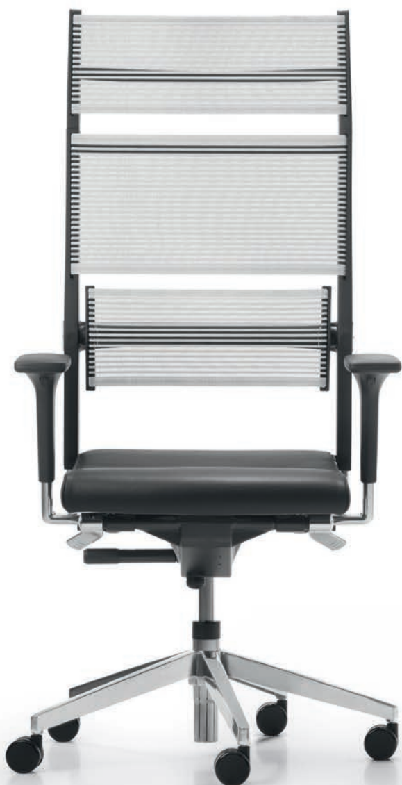
SD LO 3390 + Accoudoirs | Armleunigen A441APO

De elegante zitoplossing voor het directiekantoor. De bureaufauteuils uit de Lordo-serie zijn niet alleen erg mooi om te zien, ze zitten ook heerlijk: de gepatenteerde Syncro-Dynamic Advanced® -techniek garandeert een comfortabele en continue ondersteuning van het lichaam. De zitting en rugleuning volgen hierbij comfortabel alle natuurlijke bewegingsprocessen. De benen van de gebruiker blijven zo altijd in een comfortabele positie.