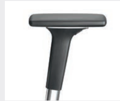
A541APO (5F) Manchettes en PU souple Armsteunen PU soft