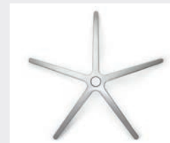
FHAPO Aluminium poli (en option) Aluminium gepolijst (optie)