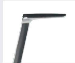
AS06APO Manchettes en PU souple Armsteunen PU soft

*avec revêtement antibactérien MicroSilver contre les contagions met antibacteriële microzilvercoating ter bescherming tegen infecties