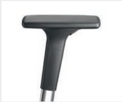
A441APO (4F) Manchettes en PU souple Armsteunen PU soft