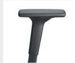
A441KGS (4F) Manchettes en PU souple Armsteunen PU soft