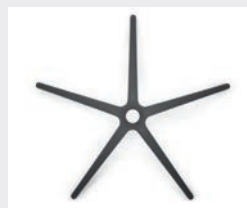
FHKGS Polyamide noir (de série) Kunststof zwart (standaard)