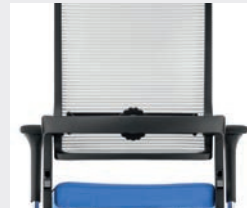
Noir (RAL 9011) Zwart (RAL 9011)