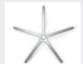
FHAPO Aluminium poli (en option) Aluminium gepolijst (optie)