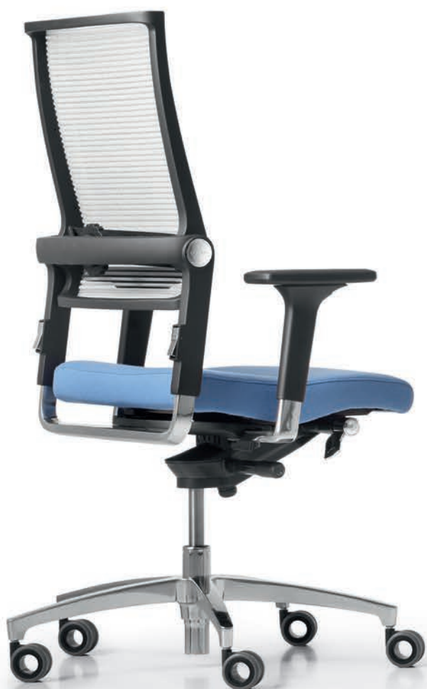
SD LO 3010 + Accoudoirs | Armleunigen A441APO