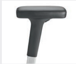
A442APO (4F) Manchettes en cuir Leren armsteunen