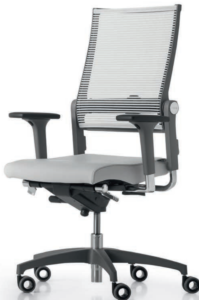
SD LO 3010 + Accoudoirs | Armléuningen A441APO