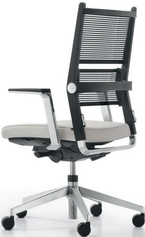
AS LO 3360 + Accoudoirs | Armleuningen AS06APO

De bezoekers- en conferentiestoelen maken de Lordo-serie compleet. Behalve het moderne design overtuigt ook hier de vlakelastische rugleuning zowel gasten als medewerkers. De uitvoering is al even flexibel: de sledestoelen zijn tot drie hoog stapelbaar, de in hoogte verstelbare conferentiestoelen zijn verkrijgbaar met glijders of wielen.