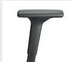
A441KGS (4F) Manchettes en PU souple Armsteunen PU soft