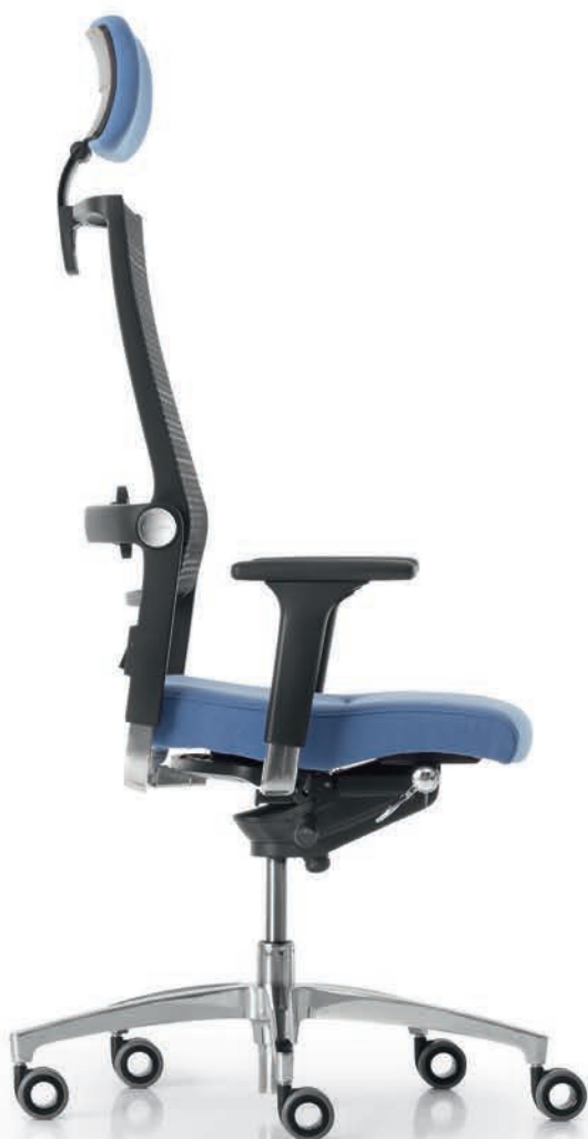
SD LO 3020 + Accoudoirs | Armléuningen A441APO