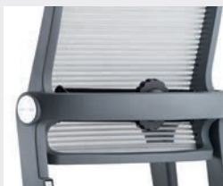
Soutien lombaire réglable en profondeur (3,5 cm) Lendensteun in diepte verstelbaar (3,5 cm)