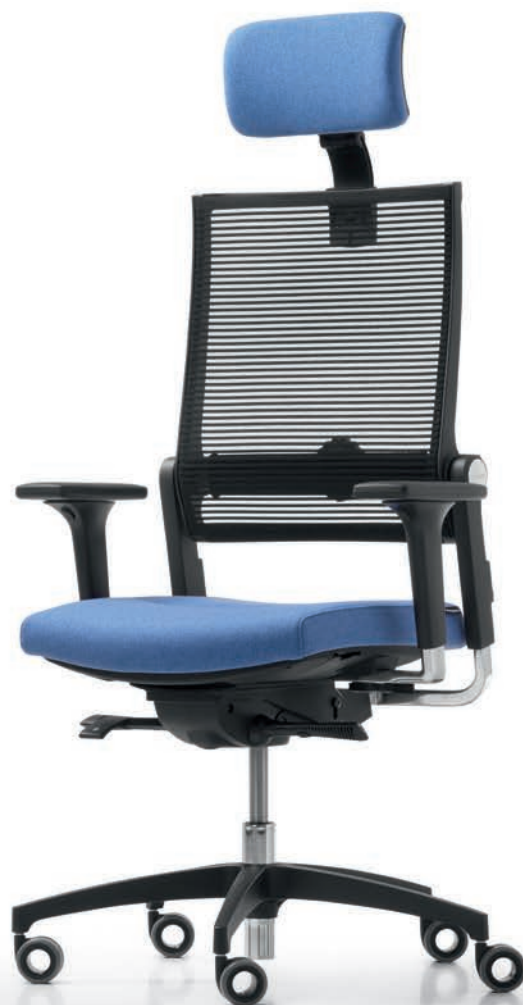
QS LO 3027 + Accoudoirs | Armléuningen A441APO

Met of zonder neksteun: dankzij de Syncro-Quickshift® -techniek passen de Lordo-bureaustoelen zich heel natuurlijk aan het bewegingsverloop van de gebruiker aan. De in drie standen verstelbare zitneiging en de verstelbare zitdiepte zorgen samen met de in vier standen vergrendelbare synchroonbeweging voor een gezonde, zeer ergonomische en intuïtief lichte werkhouding.