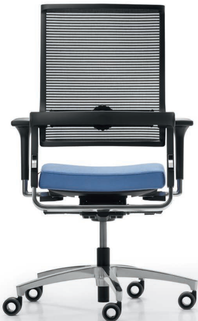
QS LO 3017 + Accoudoirs | Armléuningen A441APO

Avec ou sans appuie-nuque, grâce au mécanisme Syncro-Quickshift® , les sièges pivotants Lordo harmonisent tout naturellement avec la séquence de mouvements de leur utilisateur. Associés au mouvement synchrone verrouillable sur quatre positions, le réglage de l'inclinaison d'assise sur trois positions et le réglage de la profondeur d'assise permettent une position assise ergonomique et saine au travail.